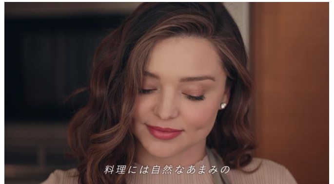
C2 テロップ「料理には自然なあまみの」