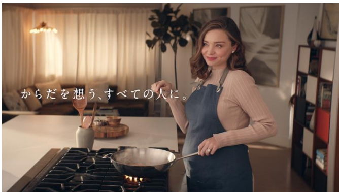
C5 からだを想う、すべての人に。