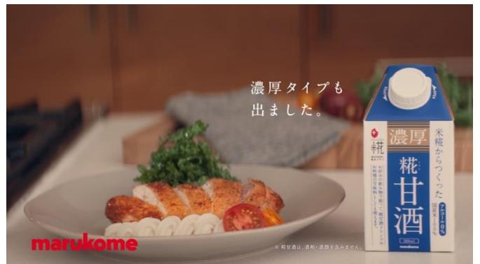
C6 濃厚タイプも出ました。

画像データは、マルコメオフィシャルサイト>企業情報>プレスリリース内の「画像のみダウンロード」ボタンから取得できます。