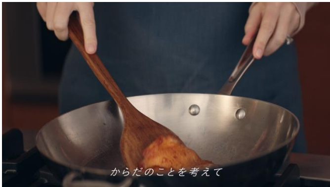
C1 テロップ「からだのことを考えて」