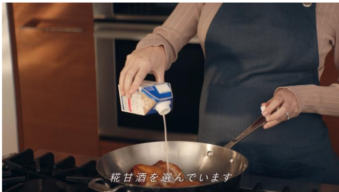
C3 テロップ「糎甘酒を選んでいきます」