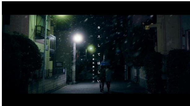
「キスしてほしい-恋愛発酵アレンジ-のん MV」

「恋愛発酵学会」のスペシャルコンテンツとして、のんさんがTHE BLUE HEARTSの名曲をカバーした「キスしてほしい-恋愛発酵アレンジ-」(恋愛発酵学会公式ソング)のオリジナルムービーを制作。情感たっぷりの歌声にのせて、ちょっぴり気になる男性とデートの帰り道、ぎこちない距離感で駅に向かう2人を描くミュージックビデオ「キスしてほしい-恋愛発酵アレンジ-のん MV」(4分3秒)と、平静を装った会話の裏で、発酵恋愛中の心の声を明かしていくWEB動画「発酵恋愛中」(30秒×2タイトル)、を、11月24日(火)より特設サイトで公開しました。