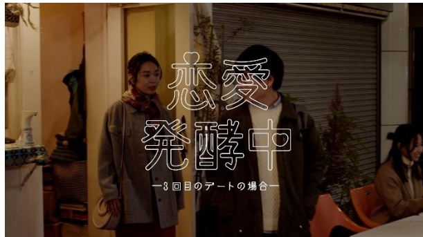
WEB動画「恋愛発酵中-3回目のデートの場合-」篇

タイトル : 「キスしてほしい-恋愛発酵アレンジ-のん MV」(4分3秒) https://youtu.be/2WnN_PA_gMg 「恋愛発酵中-友達を突然意識した場合-」篇(30秒) https://youtu.be/Rhpux3l3jh4 「恋愛発酵中-3回目のデートの場合-」篇(30秒) https://youtu.be/gxJz4VnRmu4 作詞・作曲 : 甲本ヒロト 編曲 : 川嶋可能 歌 : のん 公開日 : 2020年11月24日(火)