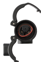
バックインを外した時